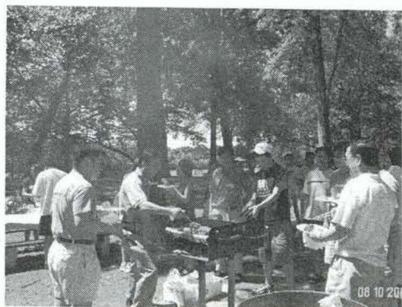
裊裊青煙中昇騰著烤肉的香味。