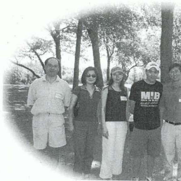
他們就是這次活動的舉辦一天，精神還不錯噢！