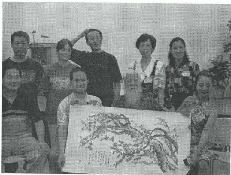
文心社成員和宋老先生合影！